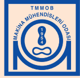
MAKİNA MÜHENDİSLERİ ODASI