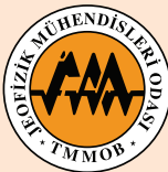
JEOFİZİK MÜHENDİSLERİ ODASI