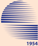
ELEKTRİK MÜHENDİSLERİ ODASI