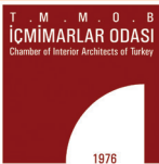
İÇ MİMARLAR ODASI