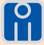
İNŞAAT MÜHENDİSLERİ ODASI