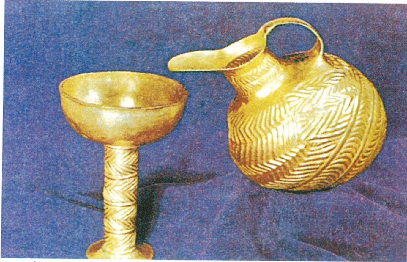
Alacahöyük Kral Mezarlarında bulunan altın kupa ile gaga ağızlı testi. M.ö. 3. binin son çeyreği.