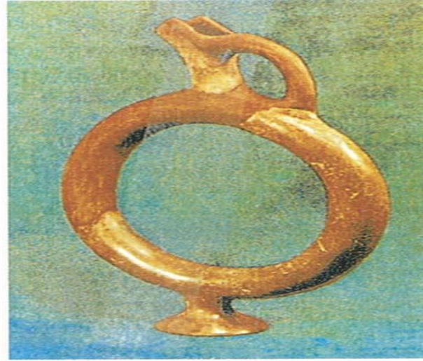
Boğazköy'de bulunan halka gövdeli ritüel içki kabı. Eski Hitit Çağı M.ö.16-15. yüzyıl sıraları.