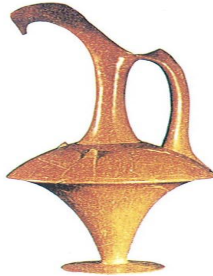
Çorum yöresinden gaga ağızlı libasyon testisi. M.ö.1600 sıraları.