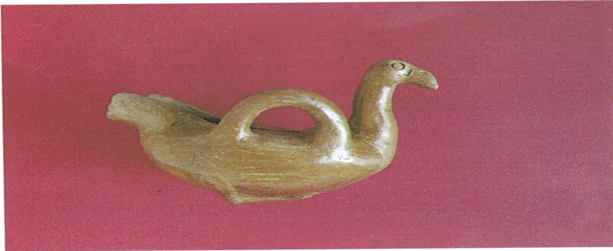
Konya-Karahöyük'te bulunan kaz ritonu. M.ö.1750 sıraları.