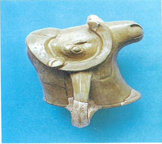
Konya-Karahöyük'te bulunan koç ritonu. M.ö.1750 sıraları.