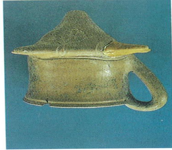
Konya-Karahöyük'te bulunan boğa ritonu.M.ö.1750 sıraları.