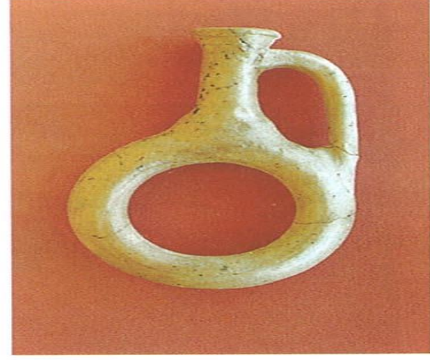
Konya-Karahöyük te bulunan halka gövdeli içki kapları. Bu kaplar ritüel amaçlarla kullanılıyordu. M.ö.1750 sıraları.