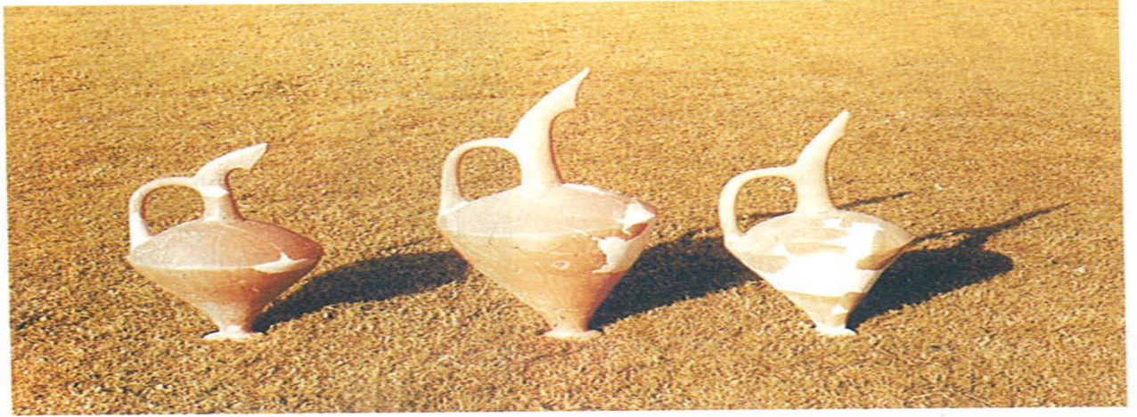
Konya-Karahöyük'te bulunan gaga ağızlı libasyon testilerinden bazı örnekler. M.ö.1750 sıraları.