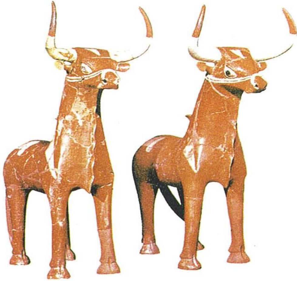
Boğazköy'de bulunan Boğa biçimli içki kapları ( BIBRU GUD.MAH ). Eski Hitit Çağı. M.ö. 1600-1500 sıraları.