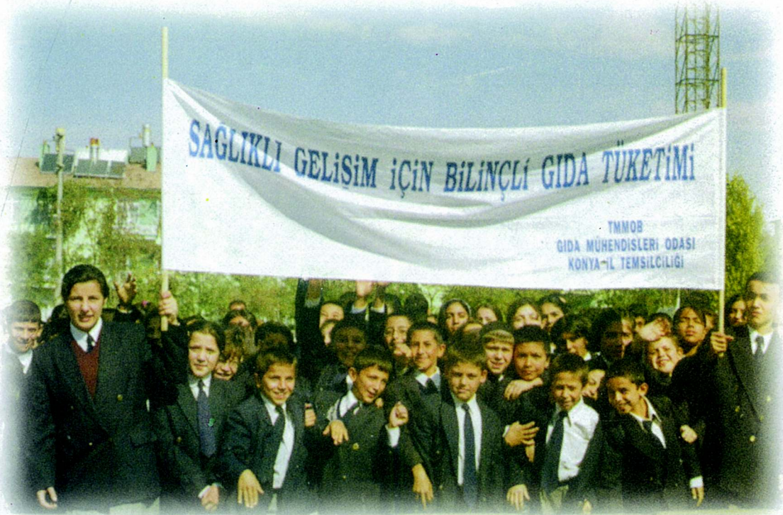
16 Ekim Dünya Gıda Günü Odamızın 13 ildeki birimlerinde kutlandı

Odamız tarafından 16 Ekim 2001 Dünya Gıda Günü nedeniyle geniş kapsamlı bir proje başlatılmıştır. Etkinliklerimizin odak noktasını, geleceğimiz olan çocuklarımızda gıda bilincini geliştirmek oluşturmuştur. Bu amaçla, Milli Eğitim İl Müdürlükleri ile işbirliğine gidilerek Türkiye genelinde 13 şehirde orta öğrenim düzeyindeki binlerce öğrenciye "Bilinçli Gıda Tüketimi" üzerine seminerler verilmiştir. Bu seminerlerde "Gıda Katkı Maddeleri, Mikroorganizmaların Yararları ve Zararları, Gıdaları Koruma Yöntemleri, Gıda Ambalajları, Bilinçli Tüketici Olmanın Şartları, Evde Gıdaların Uygun Kullanımı ve Muhafazası, son olarak da Gıda Mühendisi Ne Yapar." konu başlıklarını içeren bir broşür hazırlanarak dağıtılmıştır.