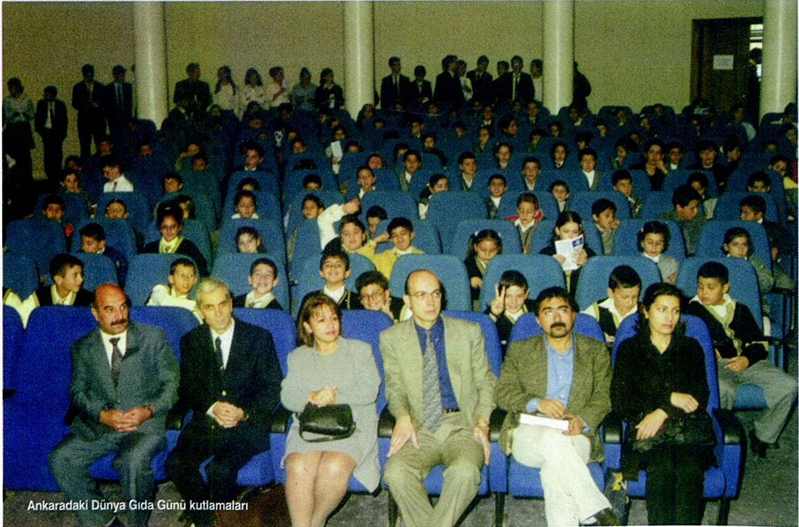
Ankaradaki Dünya Gıda Günü kutlamaları

2. Gıda mevzuatının uygulanmasındaki mevcut yetki dağınıklığı ve koordinasyonsuzluğu gidermek için gıdaya ilişkin yetkilerin tek elde toplanması veya Bakanlıklar arası koordinasyonun temin edilerek mevcut sistemin daha